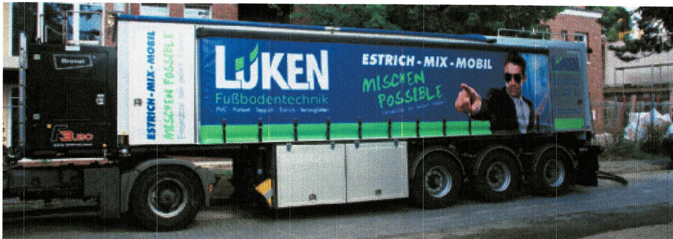
„Mischen Possible“ – die neue Zementestrichanlage Breemat F3.20 auf der Baustelle.